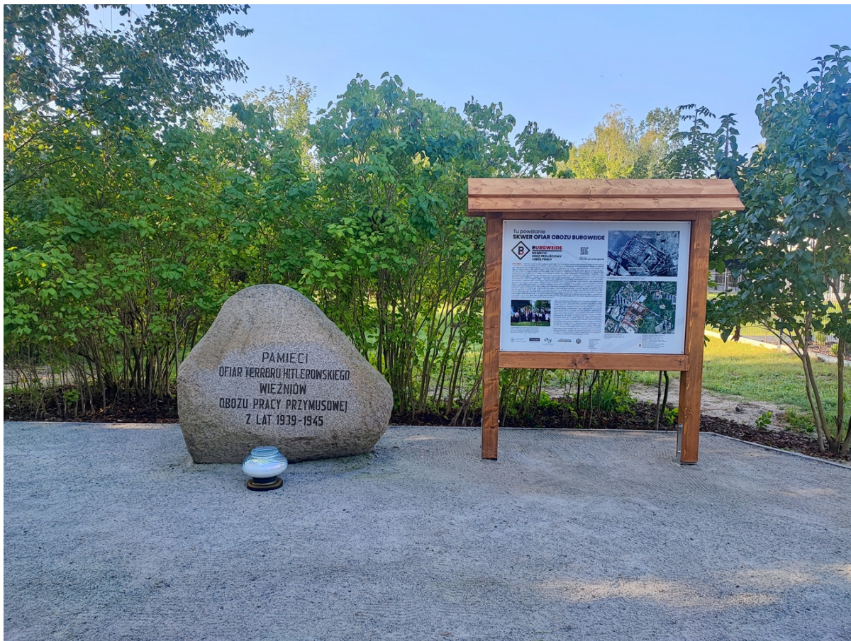
Pomnik ofiar obozu Burgweide ustawiony w nowym miejscu, obok tablica informacyjna.