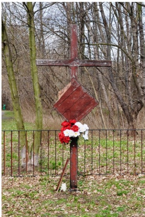
Uszkodzony krzyż zabrany z terenu pobożowego i ustawiony w lesie (parku) Sortysowickim, marzec 2021 roku.