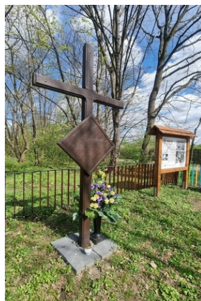
Krzyż i tablica informacyjna w lesie (parku) Sortysowickim, kwiecień 2024 roku.