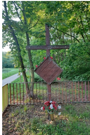
Niszczący krzyż ustawiony w lesie (parku) Sortysowickim i czekający na renowację, 2023 rok.