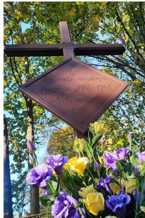
Krzyż ustawiony w lesie (parku) Sortysowickim i odrestaurowany przez Instytut Pamięci Narodowej we wrześniu 2023 roku.