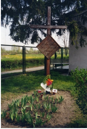
Krzyż na terenie dawnego obozu Burgweide w 2004 roku.