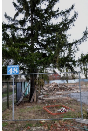
Pozostałości po zabezpieczonym przez Radę Osiedla Sołtysowice Krzyżu, luty 2020 roku.