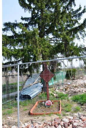
Niszczący krzyż na tle wyburzonego budynku przy alei Poprzecznej 48, kwiecień 2019 roku.